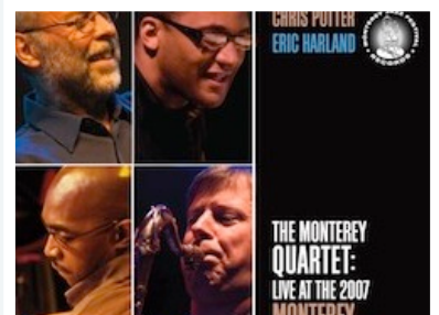
CD MONTEREY QUARTET